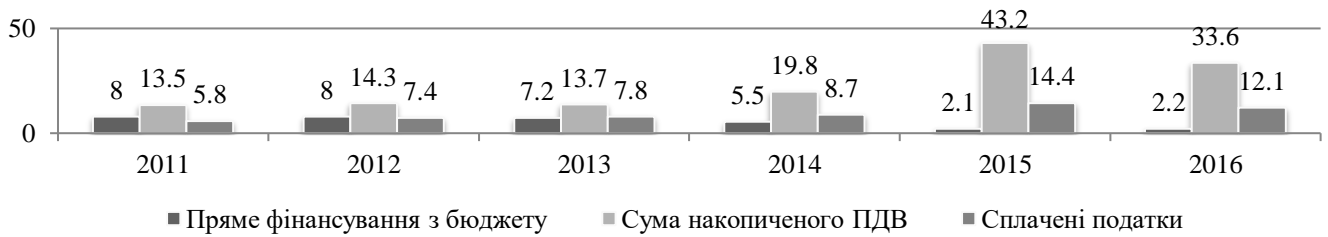
Рис. 3. Державне регулювання сільськогосподарського виробництва непрямим методом за рахунок функціонування спеціального режиму ПДВ у 2011–2016 рр., млрд грн

діяльність, що також сприяло зростанню сум сплачених податків (рис. 3).