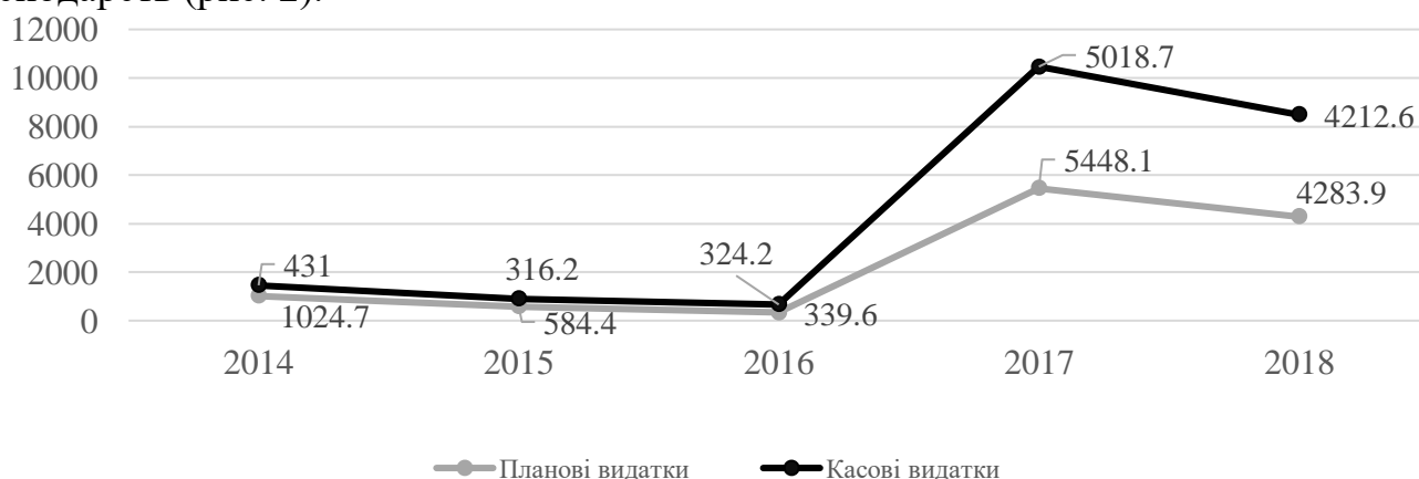
Рис. 2. Динаміка бюджетного фінансування в рамках державного регулювання сільськогосподарського виробництва у 2014–2018 рр., млн грн

Аналіз динаміки обсягів надання прямого бюджетного фінансування сільськогосподарським виробникам у 2014–2018 рр. засвідчив у цілому негативні тенденції, хоча з 2016 р. відзначається вагоме зростання, що зумовлено долученням до бюджетного фінансування не лише великих виробників, але і фермерських господарств (рис. 2).